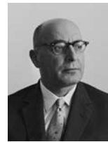
פנחס ספיר שר המסחר והתעשייה