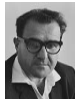
ישראל ברזילי שר הבריאות