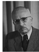
פנחס רוזן שר המשפטים