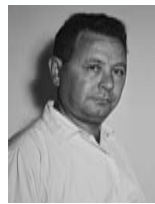
משה כרמל שר התחבורה