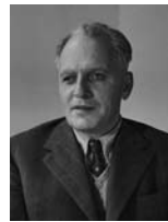
אברהם שורית שר המשטרה