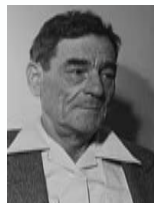
קדיש לוז שר החקלאות