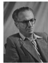
ישראל בר יהודה שר הפנים