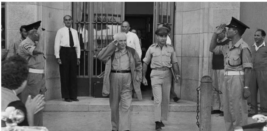
ראש הממשלה דוד בן גוריון לאחר שסיים ישיבה

המשולש של הנגב תקוע בין שתי ארצות עוינות: מצרים ועמון. מעבר לגבול המערבי הדרומי של הנגב משתרע מדבר סיני, ומעבר לגבול המזרחי מדבר ערב. הערבים הפכו לא מעט ארצות פורחות ומאוכלסות למדבריות. השממה בארצות ערב אינה מפריעה לקיומם ולעצמאותם. מדינת ישראל הקטנה לא תוכל לסבול בתוכה לאורך ימים מדבר התופס למעלה ממחצית שטחה. אם המדינה לא תחסל את המדבר - המדבר עלול לחסל את המדינה. הרצועה הצרה שבין יפו וחיפה, ברוחב של 15-25 קילומטר, המכילה רובו של העם בישראל, לא תעמוד לאורך ימים בלי יישוב רב ומבוצר במרחבי הדרום והנגב. צו קיומה של מדינת ישראל, גם צו כלכלי וגם צו ביטחוני, הוא להדרים. בלי יישוב הדרום והנגב לא ייתכן ביטחון המדינה ולא נגיע לעצמאות כלכלית.