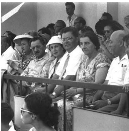
◀ מימין לשמאל: שר העבודה מרדכי נמיר, שרת החוץ גולדה מאיר ושגריר בריה"מ בישראל צופים במשחק כדורגל באצטדיון רמת גן