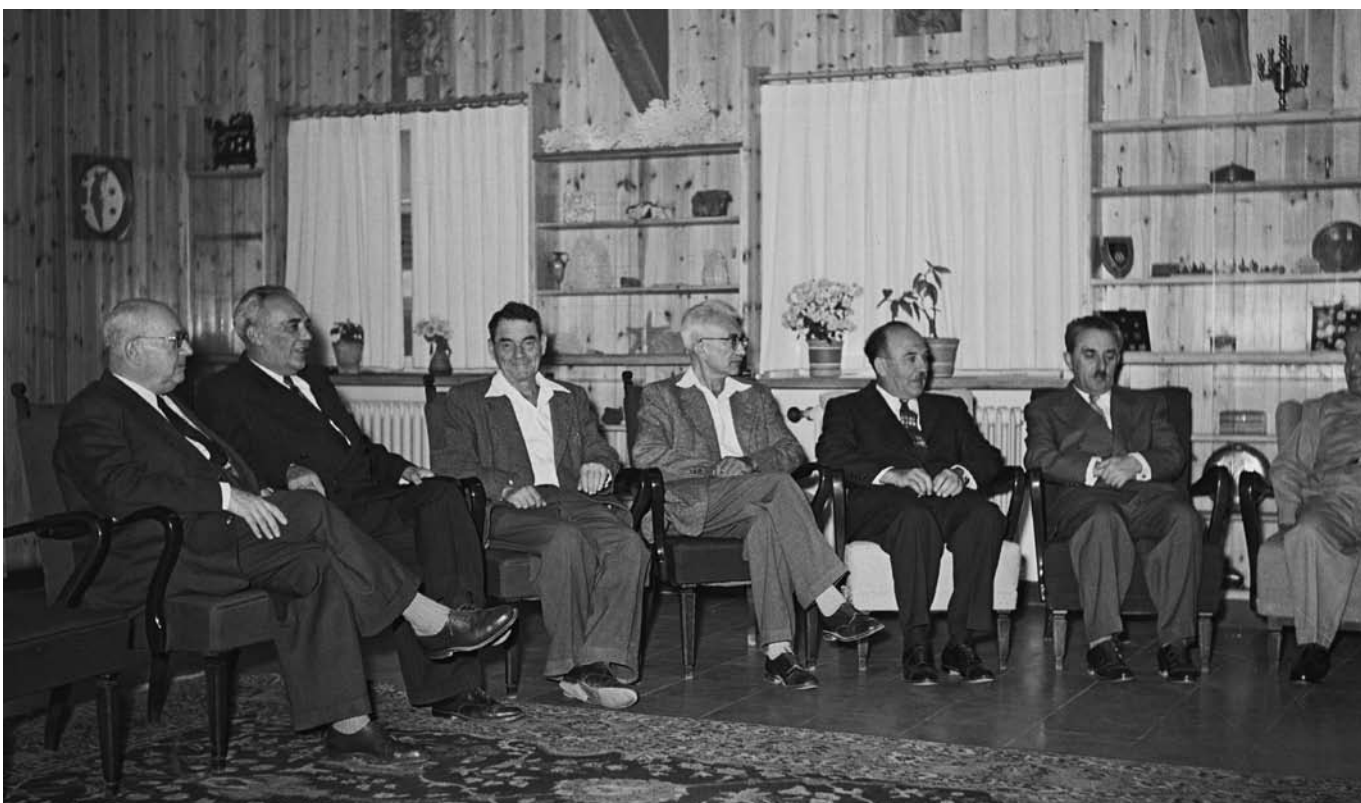
◀ שרי הממשלה ה-7 (בהרכב חסר) בבית הנשיא יצחק בן צבי בירושלים