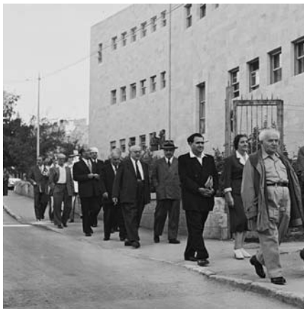
◀ יושב ראש הכנסת יוסף שפרינצק (שני מימין) ושר החקלאות קדיש לוז (משמאלו) ביום פתיחת תערוכה חקלאית בבית דגון