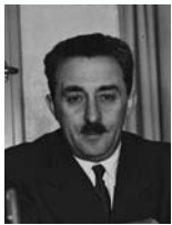
משה שרת שר החוץ