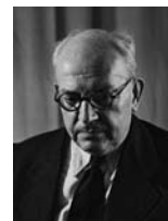
פרץ נפתלי שר בלי תיק

המוסרית ליהדות העולמית מתוך הכרת שותפות הגורל והרציפות ההיסטורית המאחדת את יהודי כל העולם לדורותיהם ולארצותיהם.