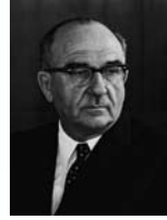
לוי אשכול שר האוצר