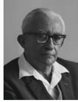
מרדכי בנטוב שר הפיתוח