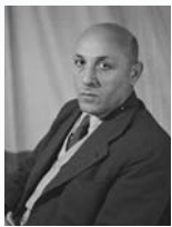
מרדכי נמיר שר העבודה