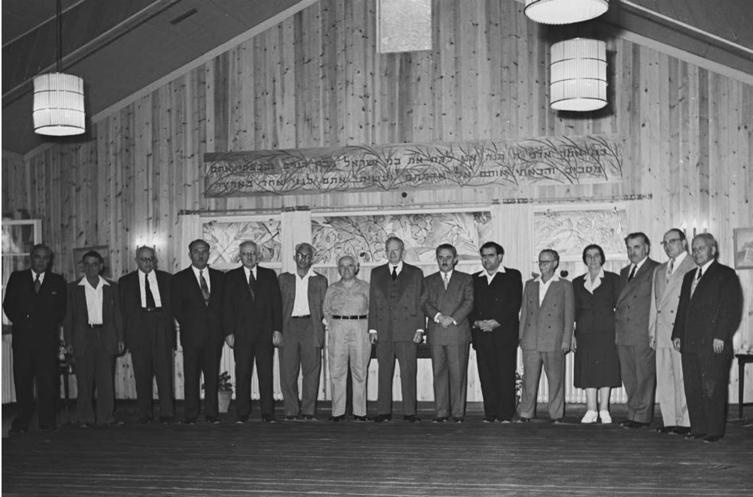
◀ הממשלה ה-7 בראשותו של דוד בן גוריון סמוך ליום השבעתה בבית הנשיא יצחק בן צבי

י"ח חשוון תשט"ז 3.11.1955 - ט"ו טבת תשי"ח 7.1.1958