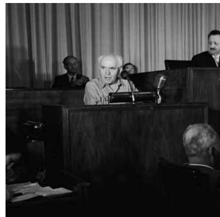
◀ ראש הממשלה דוד בן גוריון מציג את קווי היסוד של ממשלתו החדשה בפני הכנסת