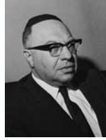
יוסף בורג שר הדואר