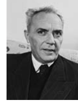
זלמן ארן שר החינוך והתרבות