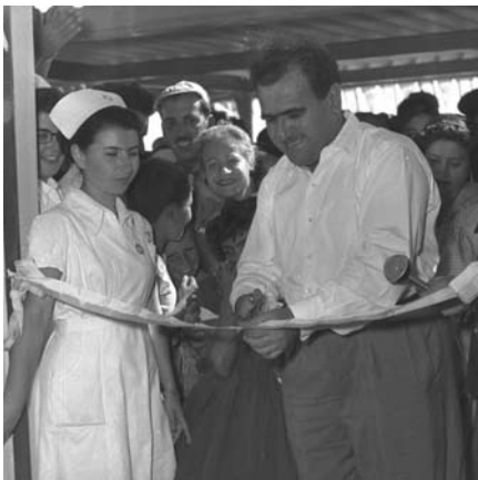
◀ שר הבריאות ישראל ברזילי במהלך טקס חנוכת בית חולים