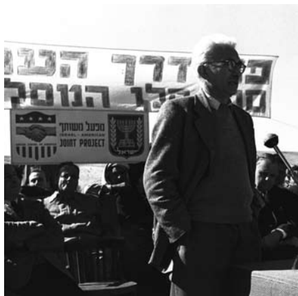
◀ שר הפיתוח מרדכי בנטוב נואם בטקס פתיחת כביש באר-שבע דימונה