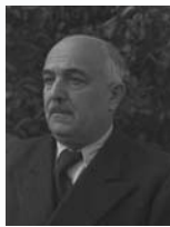
דוד רמז שר התחבורה