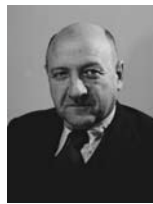
אליעזר קפלן שר האוצר שר המסחר והתעשייה