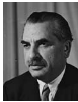
חיים משה שפירא שר הבריאות, שר העלייה שר הפנים