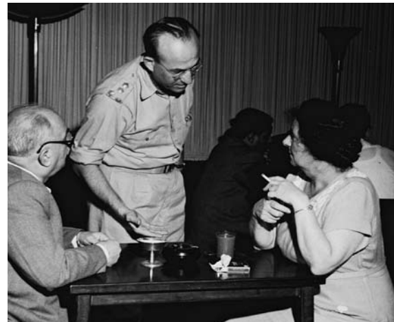
מימין שרת העבודה גולדה מאיר, עומד שר התחבורה דוד רמז

עם הקמת מדינת ישראל נהפכנו מתובע לנתבע. מעכשיו אנו אחראים לארץ זו. השממה תובעת עלבונה מאיתנו, והעזובה הממושכת תיזקף על חשבוננו.