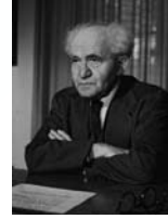
דוד בן גוריון ראש הממשלה ושר הביטחון