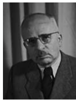
פנחס רוזנבלט (רוזן) שר המשפטים