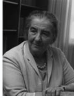
גולדה מאירסון שרת העבודה והביטוח העממי