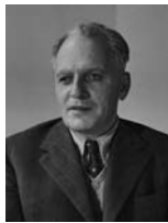
בכור שלום שטרית שר המשטרה