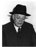
יהודה לייב הכהן מימון שר הדתות השר לנפגעי מלחמה