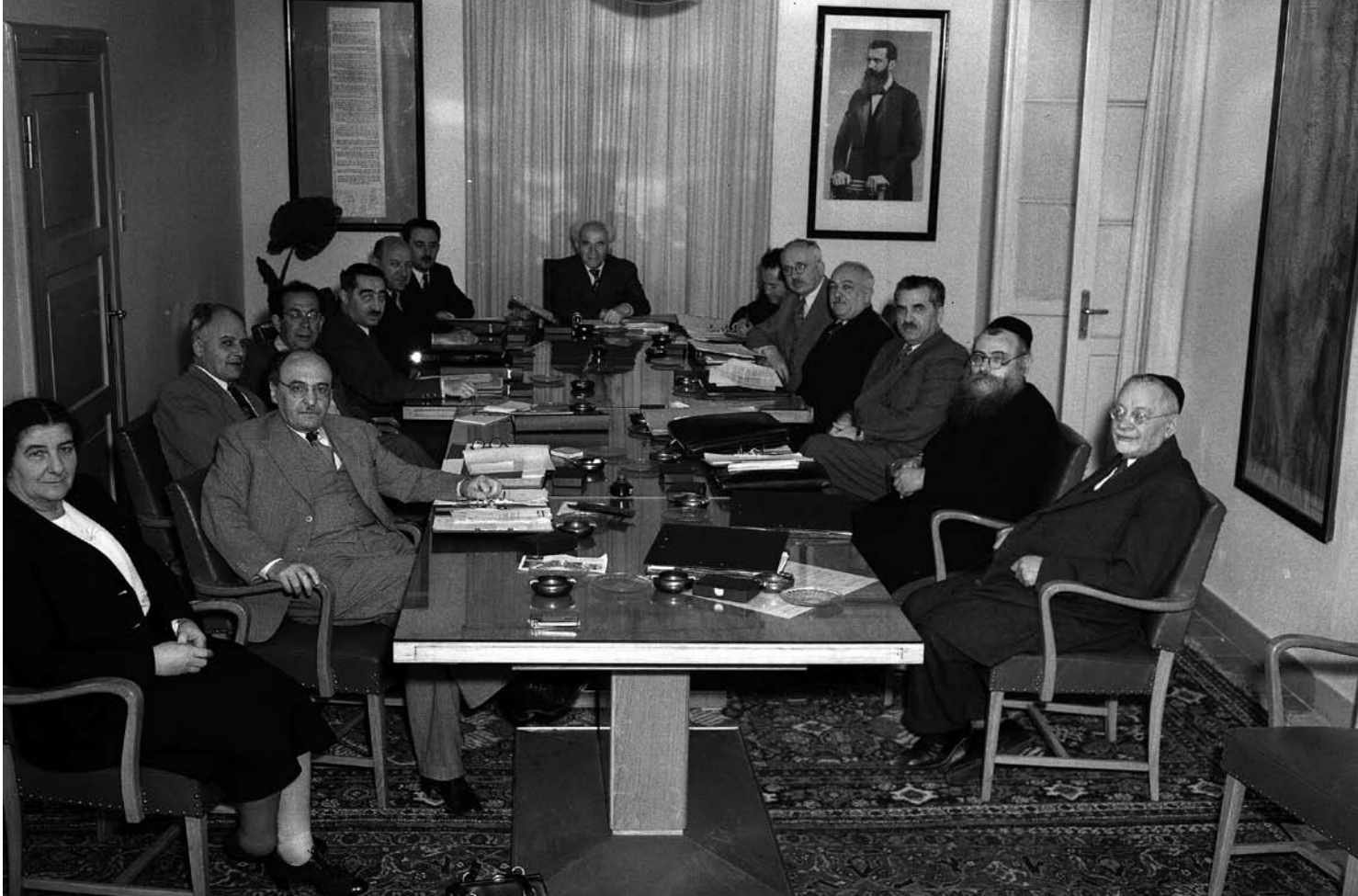
◀ הממשלה ה-1 בראשותו של דוד בן גוריון סמוך לכינונה במשרד ראש הממשלה בתל אביב

ט' אדר תש"ט 10.3.1949 - כ"א חשוון תשי"א 1.11.1950