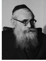
יצחק מאיר לורין שר הסעד