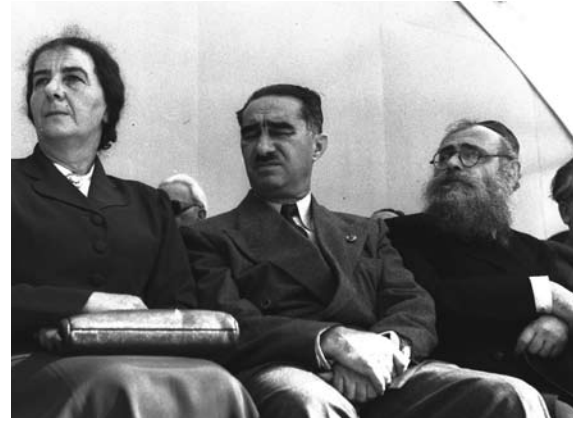
מימין לשמאל: שר הסעד יצחק לוין, שר הקיצוב והאספקה דב יוסף ושרת העבודה גולדה מאיר