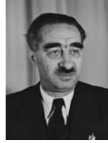
דב יוסף שר האספקה והקיצוב שר החקלאות