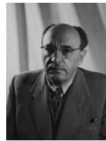
זלמן שזר שר החינוך והתרבות

שנכנס לצבא בלי מקצוע - תינתן לו האפשרות ללמוד מקצוע. המדינה תדאג לקיום המשפחות שמפרנסיהן נפלו במלחמה או איבדו בה כושר עבודתם.