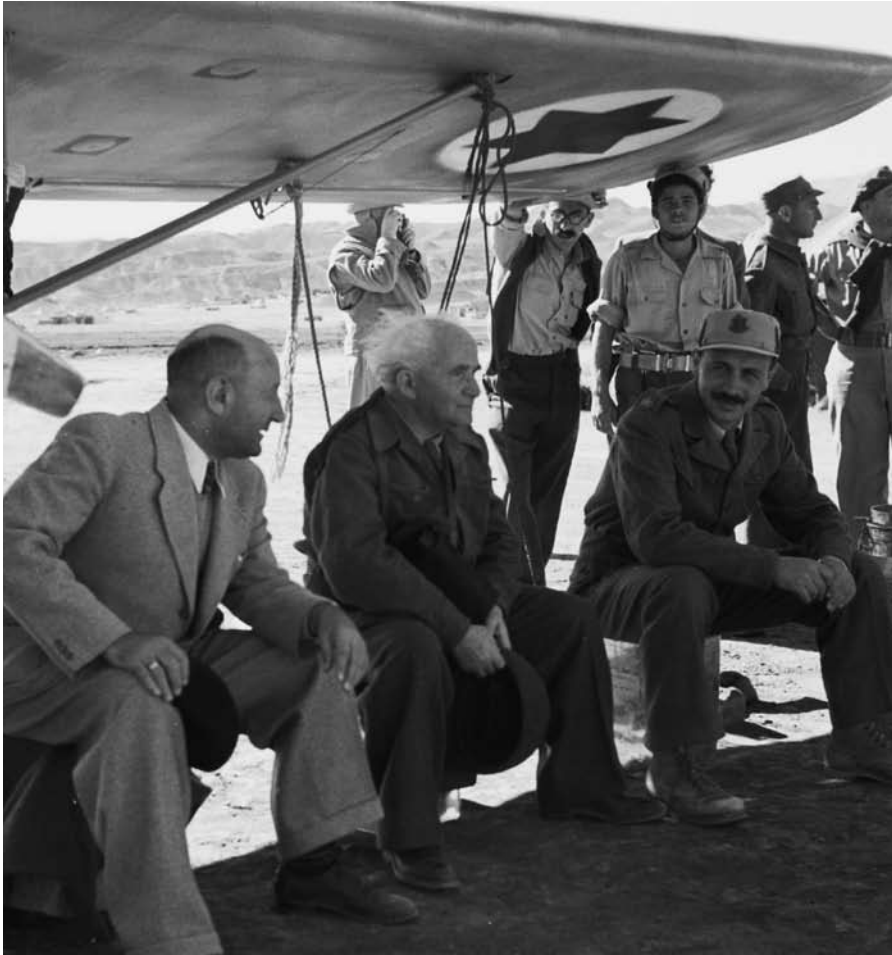
ראש הממשלה דוד בן גוריון, משמאלו שר האוצר אליעזר קפלן, מימינו הרמטכ"ל יגאל ידין

דברי ראש הממשלה דוד בן גוריון בפתח שנתון הממשלה תש"י (1950)