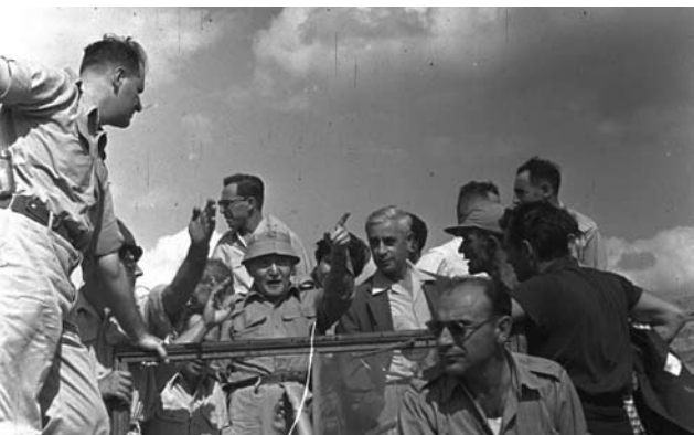
ראש הממשלה דוד בן גוריון, מימינו השר פנחס לבון, במהלך סיור