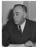
ישראל רוקח שר הפנים