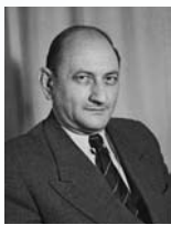
יוסף ספיר שר הבריאות שר התחבורה