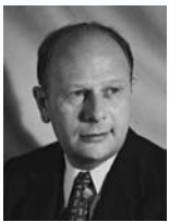
יוסף סרלין שר התחבורה שר הבריאות