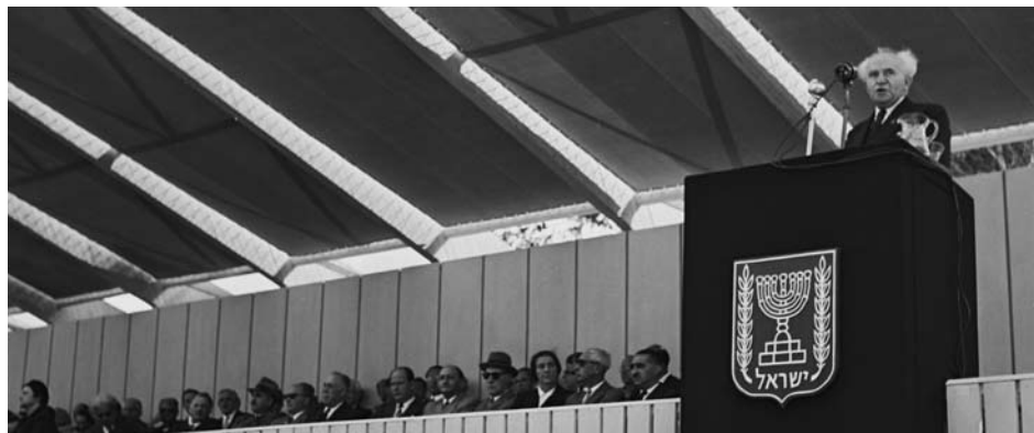
ראש הממשלה דוד בן גוריון נואם בטקס זיכרון לנשיא חיים ויצמן