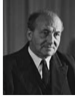
פרץ ברנשטיין שר המסחר והתעשייה