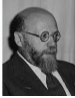
בן ציון דינבורג דינור שר החינוך והתרבות