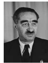
דב יוסף שר בלי תיק שר הפיתוח