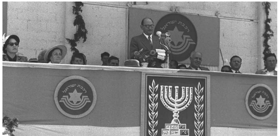
שר התחבורה יוסף ספיר נואם במהלך טקס חנוכת קו רכבת

האחדות המושלמת והמלאה שנתגלתה ביום הקמת המדינה היא בדרך הטבע הופעה חד פעמית, יחידה במינה ובזמנה, הופעת חסד של שעה היסטורית גדולה.