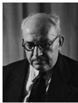
פרץ נפתלי שר החקלאות