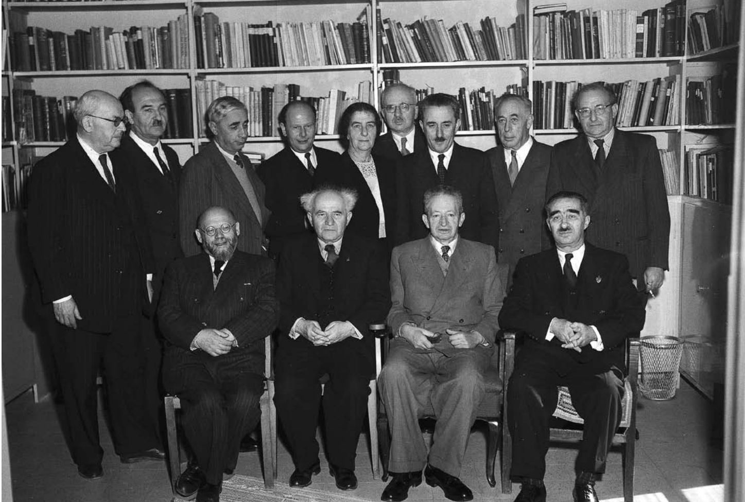
◀ הממשלה ה-4 בראשותו של דוד בן גוריון ביום כינונה עם נשיא המדינה יצחק בן צבי

ו' טבת תשי"ג 24.12.1952 - כ"ב שבט תשי"ד 26.1.1954