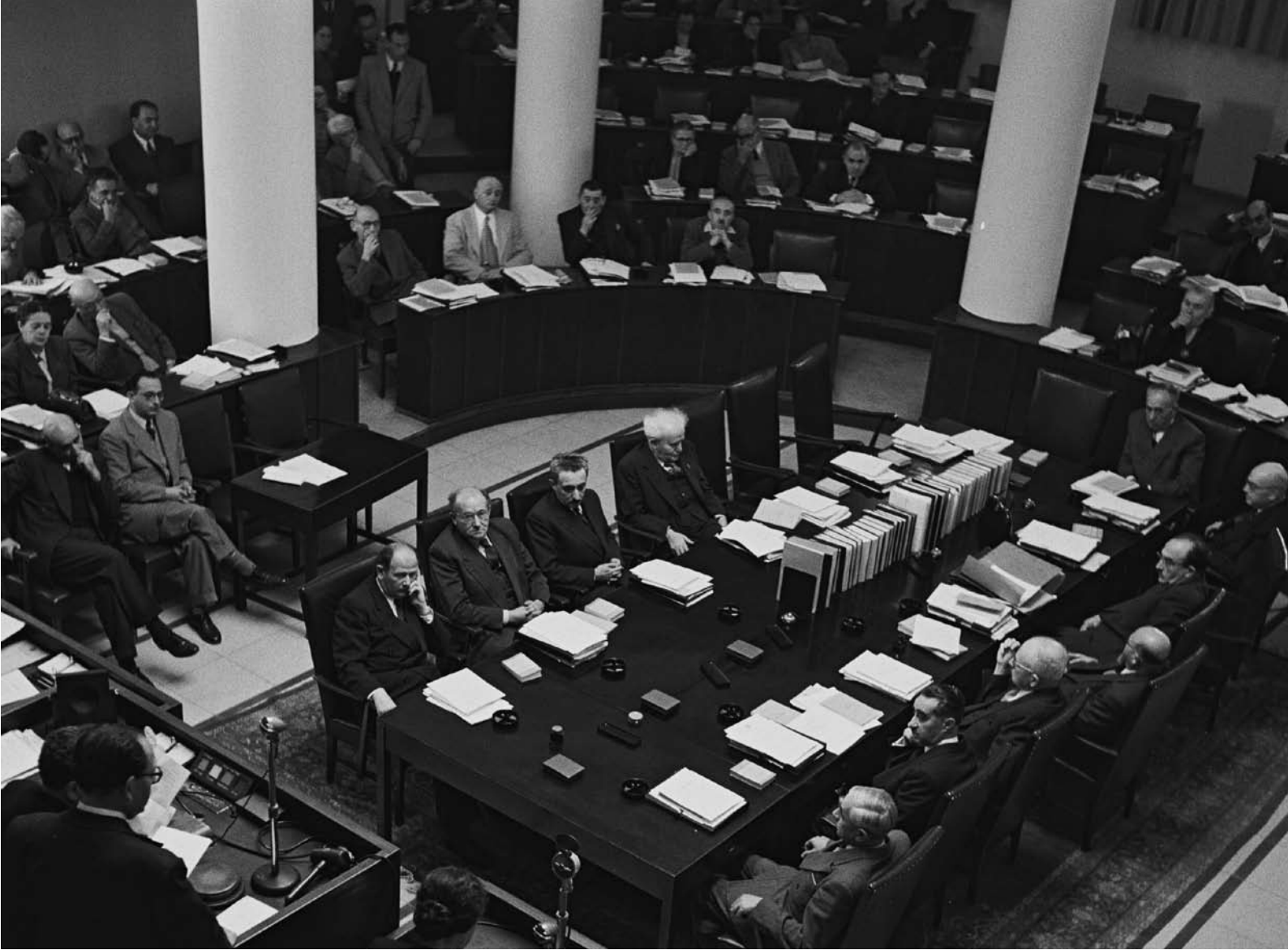
יום הצהרת האמונים של הממשלה ה-4 בכנסת