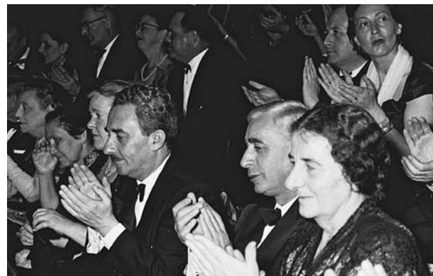
מימין לשמאל: שרת העבודה גולדה מאיר, השר פנחס לבון ושר החוץ משה שרת בתיאטרון הבימה