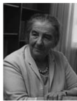
גולדה מאירסון שרת העבודה