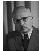
פנחס רוזן שר המשפטים

הישראלי וכמו כן לייצוב המחירים. תקציב הפיתוח יבוסס על עודף ההכנסות בתקציב, על מלווים פנימיים ועל אמצעים שיתקבלו מחוץ לארץ, אם בתור הענקה, שילומים או מלווה לזמן ארוך - במסגרת התקציב הכולל של מטבע חוץ. שיטת מס ההכנסה תיבדק מיד, על מנת להגיע לדרגת אמת והטלת עול צודק על כל אזרחי המדינה. עול המיסים יוטל על התושבים בהתאם ליכולתם של מחויבי המס. בהטלת המיסים תביא הממשלה בחשבון את הצורך בפיתוח היוזמה המשקית, בעידוד הייצור, בשכלול התוצרת ובהרמת התפוקה ופיריון העבודה. יינקטו אמצעים יעילים לגביית המס על ידי השבחת המנגנון והקמת ועדי הערכה. דאגה מיוחדת תוקדש להגברת פיריון העבודה, ליעול המינהל המשקי ולהשבחת טיב התוצרת. ועדי ייצור משותפים של פועלים ונותני עבודה ייקבעו במקומות עבודה חשובים, ויינתנו פרסים להשבחת התוצרת ולהגברת הפיריון שיהנו מהנחות ממס הכנסה.