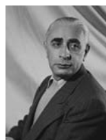
פנחס לבון שר בלי תיק