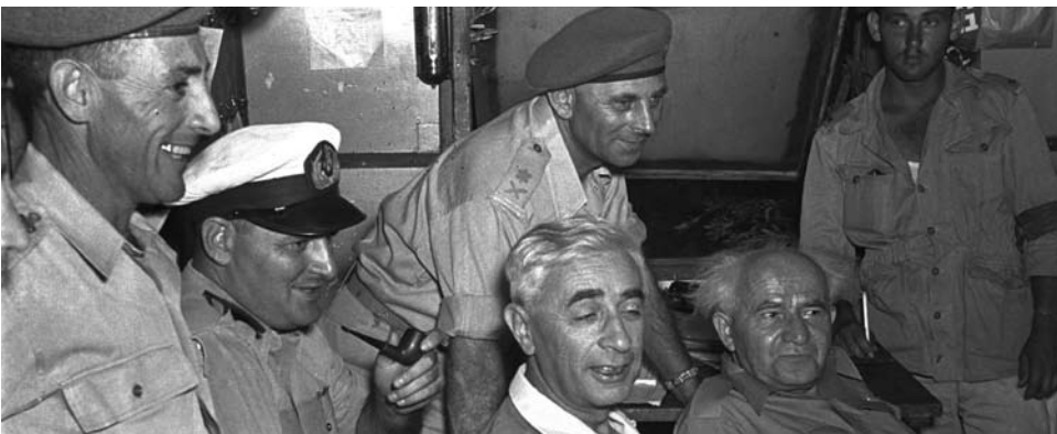
ראש הממשלה דוד בן גוריון, משמאלו השר פנחס לבון, במהלך ביקור בבסיס צה"ל